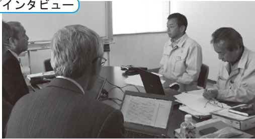
トップインタビュー

(財)日本品質保証機構(JQA)によるISO9001(品質)、ISO14001(環境)の更新審査が、3月8日～3月11日の4日間、中国サイト。3月28日～3月30日の3日間、日本サイトで実施されました。