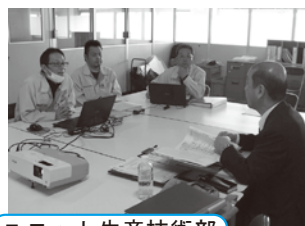
ユニット生産技術部