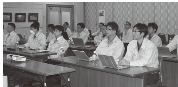
トーヨーサークル本部大会議室