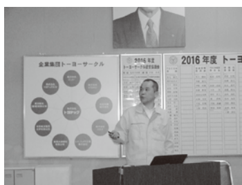
信長精機事業部長