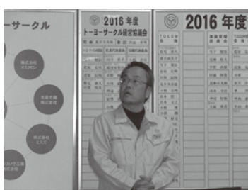
清水日本ユニット管理部長