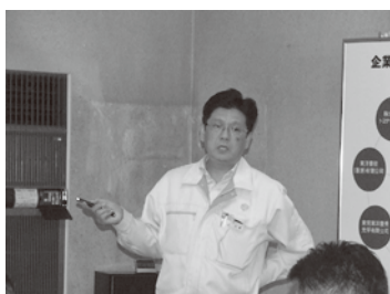
位高開発技術部長

当日は中国豊技工廠テレビ会議室を中継し出張されていた部長や現地赴任の代表者と繋がりました。