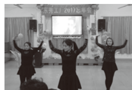
豊技工場 1月27日 柴火酒店