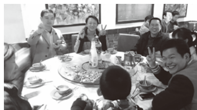
光徳工場 2月2日 湘閣里辣店

各工場とも社員が企画参加し舞踊、カラオケ、合唱、ゲーム等の催しがありました。また恒例のお楽しみ大抽選会を楽しみました。