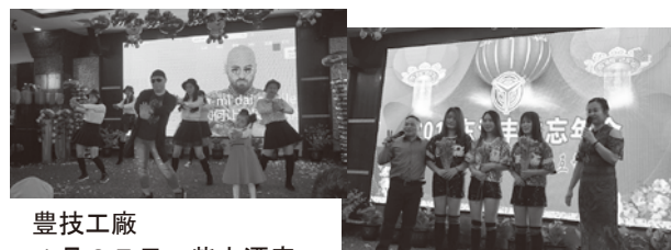
豊技工場 1月27日 柴火酒店