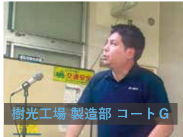
樹光工場 製造部 コートG

UV接着剤の未硬化を予防する取り組みを発表しました。UVに掛けて、資料のテーマカラーを青にしましたが、気づいていただけたでしょうか。当日は早口になっていたもので、話し方のスキル向上を目指していきたいです。