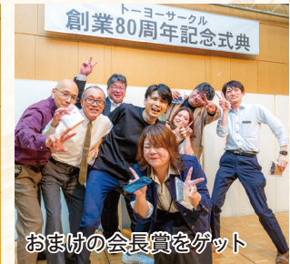
おまけの会長賞をゲット