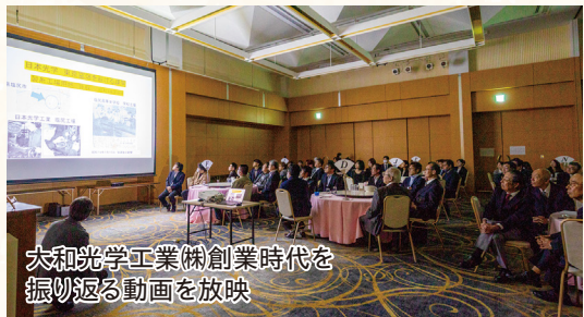
大和光学工業(株)創業時代を振り返る動画を放映