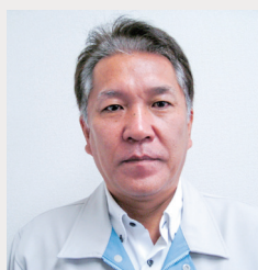
業績管理委員会 委員長